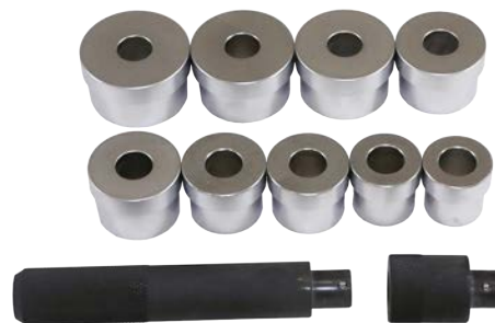
キングピンブッシュツール (2t~ 大型車)