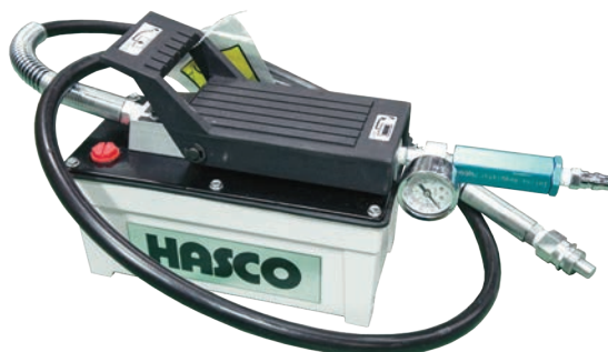
エアーハイドロポンプ