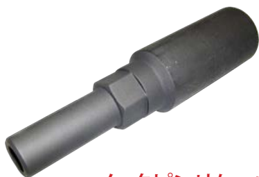
ノックピンリムーバー