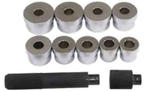
キングピンブッシュツール (2t~ 大型車)