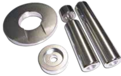
2t 用オプションパーツセット