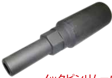
ノックピンリムーバー