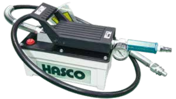
エアーハイドロポンプ