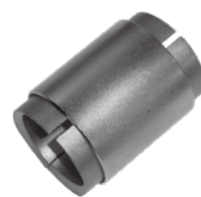
延長カラーセット図