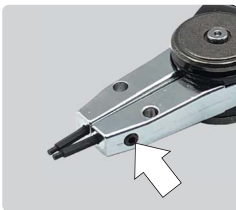
●先端チップはイモネジで交換出来ます。