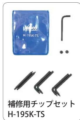
補修用チップセット H-195K-TS