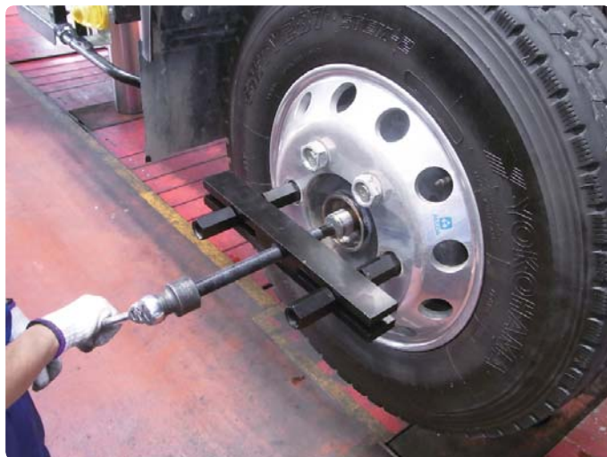
●アルミホイールを傷付けずに作業が可能