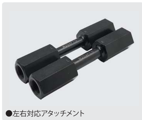
●左右対応アタッチメント