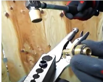
②プラハンでたたいて...