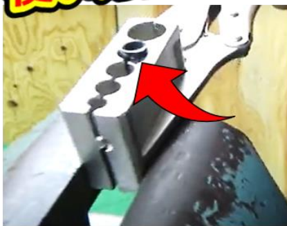
①ホースを挟んでバイス固定