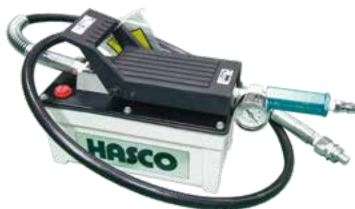
AHP-2500H エア- hidroポンプ