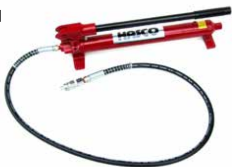
HAS-810P 油圧ハンドポンプ 10t