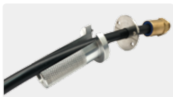
アタッチメント・ハンドルを チューブにセット