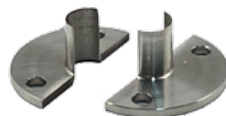
専用割れアタッチメント