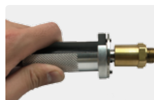
奥の爪を押し、 チューブが抜けます