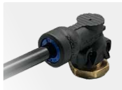
トレーラーや UD で 使用されているエアチューブ