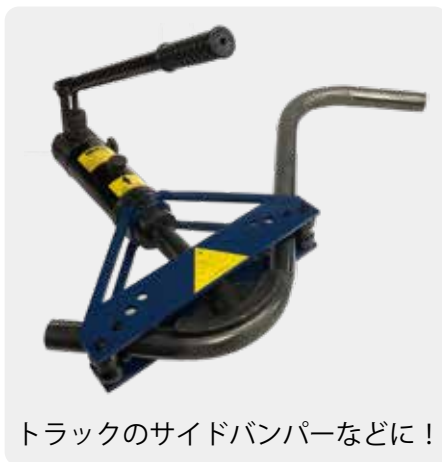
トラックのサイドバンパーなどに！