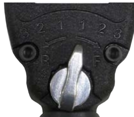
正逆回転レバー & 3段階レギュレーター

※商品の仕様・外観は、改良のため予告なく変更することがあります。予めご了承ください。 ※各製品の最大トルク値などは当社で定める基準で測定したときのものです。 実作業において、その数値を保証するものではありません。