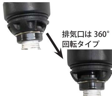
排気口は 360° 回転タイプ