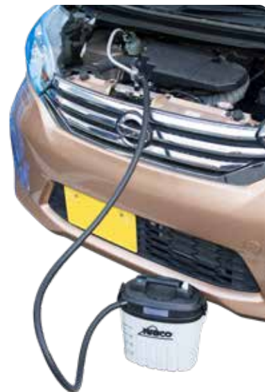
フルード供給は OM-55S におまかせ！