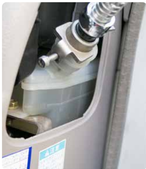
先端ノズルはネジが付いており、リザーバータンクに簡単に装着可能