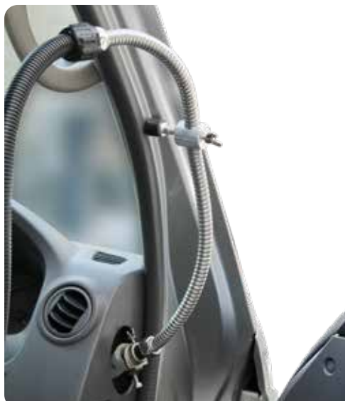
マグネット付フレキシブルホースで様々な車種に楽々セット