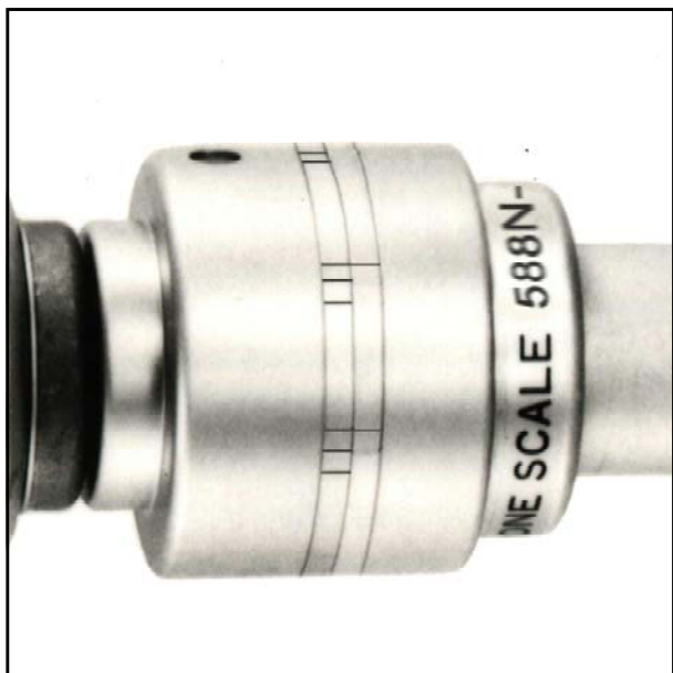
◎右(R)ネジ締め付けトルク588N-mのメーター表示位置