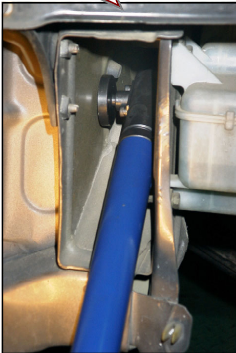
部品番号・各部名称