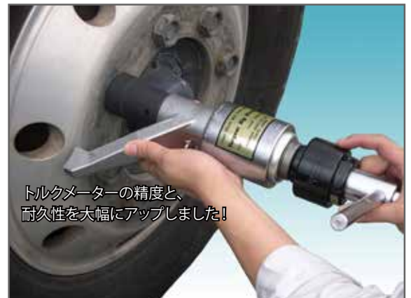
トルクメーターの精度と、耐久性を大幅にアップしました！