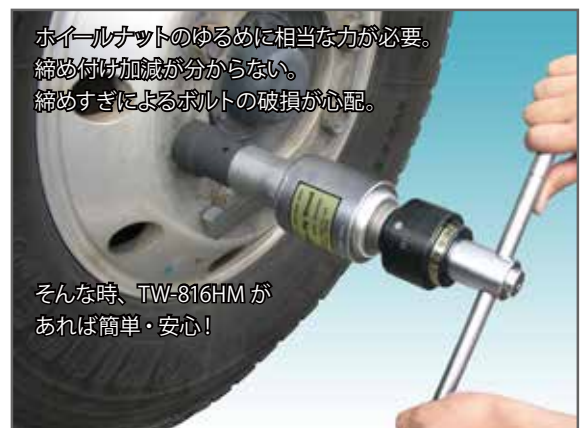
ホイールナットのゆるめに相当な力が必要。締め付け加減が分からない。締めすぎによるボルトの破損が心配。