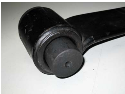
※ラバーブッシュを抜いた側から-07アタッチメントのヘコミ側が表になる様にセットします。