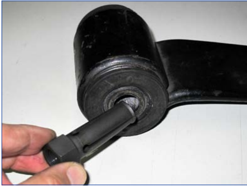
-04チャック(A)を向き合っているラバーブッシュの内径の隙間に入れます。

本ツールは純正ブッシュ品番8-97374410-0、8-97184699-1に適応します。正しく安全にご使用いただくため、必ず本取扱説明書をお読みいただき、内容を十分にご理解いただいた上でご使用ください。