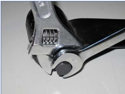
②で確認後に再度工具にてチャック(A)に-06押し棒を締め込み、ブッシュカラーに固定します。