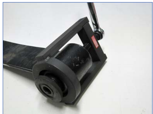
プレッシャーボルトを締め込み、反対側のラバーブッシュを抜き取ります。