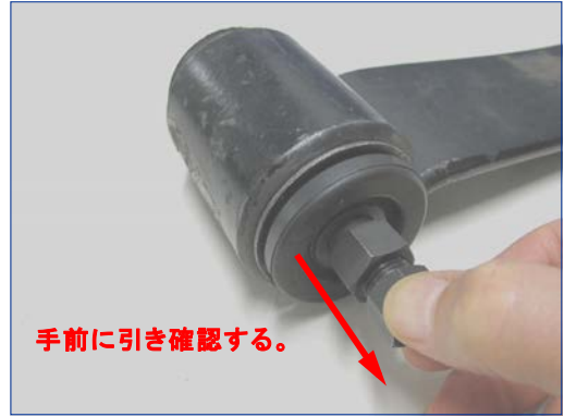
手前に引き確認する。