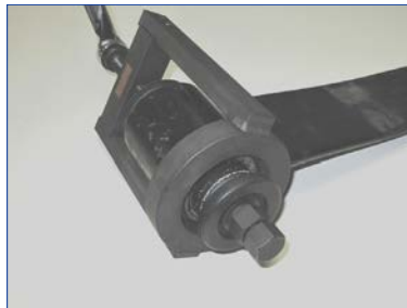
片側のラバーブッシュを抜いている状態。