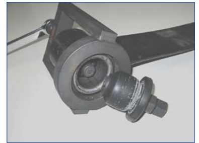
片側のラバーブッシュのみが抜けた状態。