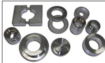
TR-414G 用(φ 65 割れブッシュ) アタッチメント