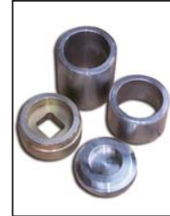
TR-414S 用 (φ 105) アタッチメント