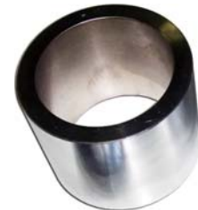
● TR-406G-05 受け台 A (大型用) オプション品の受け台もごございます。