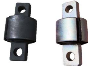
スタビリンカーブッシュ ↑ 純正品番