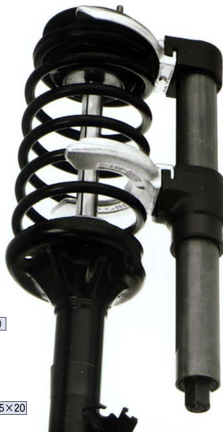
スプリングジョー