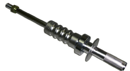
別売：スライディングハンマー 型式：SH-18（ハンマー1.8kg）