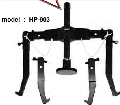
model : HP-903