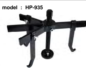
model : HP-935