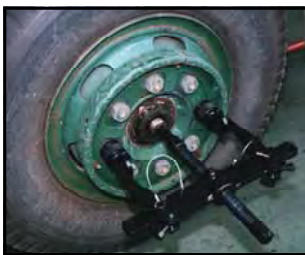
model : HP-903-AW アルミホイール用アダプター使用例