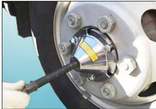
スライディングハンマー (SH-36・別売)