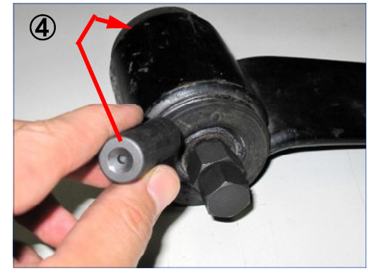
④ -03当て金のヘコミ側が表になる様に反対側からセットします。