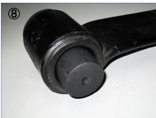
⑧ ※ラバーブッシュを抜いた側から-07アタッチメントのヘコミ側が表になる様にセットします。