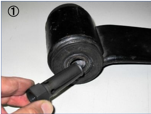
① -04チャック(A)を向き合っているラバーブッシュの内径の隙間に入れます。

本ツールは純正ブッシュ品番8-97374410-0、8-97184699-1に適応します。正しく安全にご使用いただくため、必ず本取扱説明書をお読みいただき、内容を十分にご理解いただいた上でご使用ください。