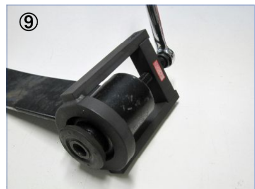
⑨ プレッシャーボルトを締め込み、反対側のラバーブッシュを抜き取ります。