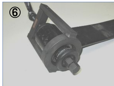
⑥ 片側のラバーブッシュを抜いている状態。