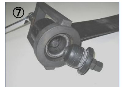
⑦ 片側のラバーブッシュのみが抜けた状態。