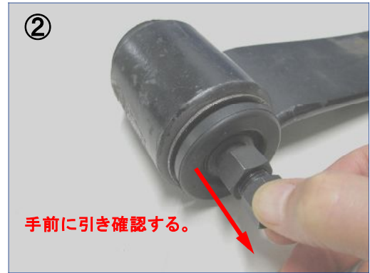
② -04チャック(A)に-06押し棒を軽く締め込みラバーブッシュの内径の隙間に入っているか手前に引いて確認してください。