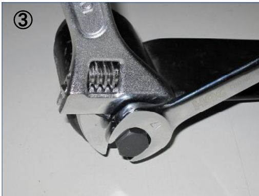
③ ②で確認後に再度工具にてチャック(A)に-06押し棒を締め込み、ブッシュカラーに固定します。