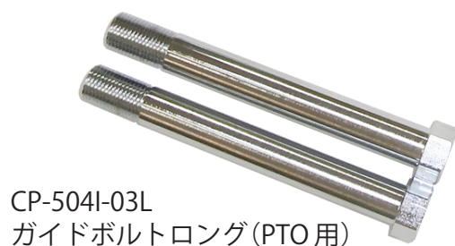
CP-504I-03L ガイドボルトロング(PTO用)