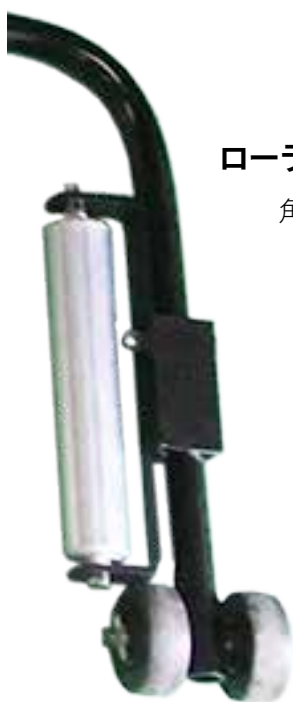
ローラー部拡大 角度調整可能