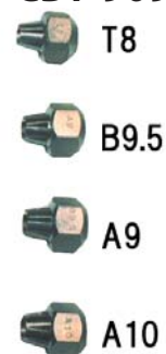
アタッチメント ナット