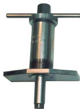
ピストン押込器本体 CBT-909E